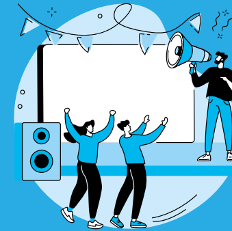
Líderes de opinión

avgenderconsultoras.com D. Av. Insurgentes Sur 1673, Desp. 401, Col. Guadalupe Inn, Alcaldía. Álvaro Obregón, C.P. 01020 CDMX T. (+52) 55673-29367, 55673-10646 R. facebook.com/avgenderconsultoras C. contacto@avgenderconsultoras.com